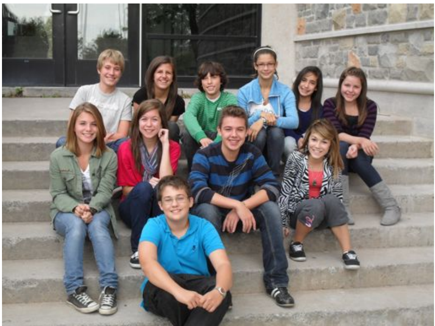
L'équipe du premier numéro

Quoi qu'il en soit et malgré mon incompétence notoire, on ne peut donc que souhaiter longue vie à ce nouveau journal de l'école Jean-Baptiste-Meilleur!